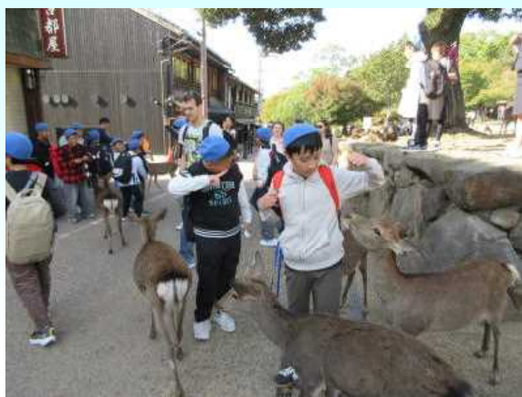
奈良公園 鹿と一緒に

奈良・京都への修学旅行。6年生は、1泊2日の活動を通して日本の歴史にふれ、友達と楽しい時間を過ごしました。