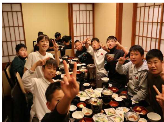
旅館での一コマ 食事タイム