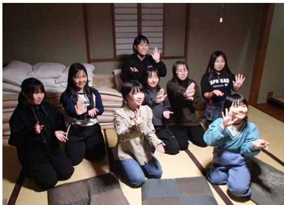
旅館での一コマ 部屋でくつろぎ中